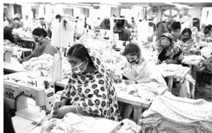
داده‌های دفتر توسعه صادرات بنگلادش (EPB) نشان می‌دهد که درآمد صادرات این کشور از بخش پوشاک آماده (۳۰،۶۱ میلیارد دلار می‌باشد که رشد اقتصادی ۸،۷۶ درصدی نسبت به سال گذشته نشان می‌دهد.

صنعت پوشاک، برای ۴۰ میلیون کارگر اشتغال ایجاد نموده است که بیشتر آنان از زنان روستایی می‌باشند. این اشتغال تاکنون به میزان ۸۳/۴۹ درصد به صادرات کل بنگلادش از ۳۶۶۶ میلیارد دلار کمک کرده است. درآمد صادرات بنگلادش از بخش پوشاک، به لطف پیشرفت‌های ایمن در این بخش، رشد ۸/۷۶ درصدی را در سال ۲۰۱۸ به میزان ۳۰۶۱ میلیارد دلار نشان می‌دهد. صنعت پوشاک، با وجود ۴۰ میلیون کارگر که بیشتر آنان را زنان روستایی تشکیل می‌دهند، تا کنون به میزان ۸۳/۴۹ درصد به کل صادرات بنگلادش از ۳۶۶۶ میلیارد دلار کمک کرده است. براساس اطلاعات منتشر شده از دفتر توسعه صادرات بنگلادش در روز چهارشنبه، درآمد صادرات بنگلادش از بخش پوشاک آماده ۳۰۶۱ میلیارد دلار است که رشد ۸/۷۶ درصدی در سال مالی گذشته را نشان می‌دهد. این رقم ۱/۵۱ درصد بالاتر از هدف ۳۰،۱۶ میلیون دلاری برای سال ۲۰۱۸ بوده است. در سال مالی ۲۰۱۷، درآمد صادرات بنگلادش رشد ۰/۲ درصد را تا ۲۸،۱۵ میلیارد دلار نشان داده است که پایین‌ترین رقم رشد ثبت شده در پانزده سال گذشته است. از مجموع محصولات بافته شده در بخش بافندگی حلقوی ۱۵،۱۸ میلیارد دلار بدست آمده است که ۱۰/۴۰ درصد بالاتر از ۱۳،۷۶ میلیارد دلار نسبت به همان دوره در سال گذشته بوده است. محصولات بافته شده در بخش بافندگی تار پودی ۱۵،۴۲ میلیارد دلار بدست آمده است که ۷/۱۸ درصد در مقایسه با ۱۴،۳۹ میلیارد دلار سال گذشته افزایش یافته است. در ضمن، درآمد کلی صادرات بنگلادش به ۳۶۶۶ میلیارد دلار رسیده است که نسبت به درآمد سال گذشته (سال ۲۰۱۷) که معادل با ۳۴۶۵ میلیارد دلار گزارش شده بود در حدود ۵/۸ درصد افزایش یافته است.